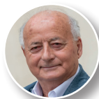
Michel PARENT Président de la communauté de communes de l'île d'Oléron